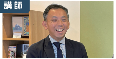
家族葬のゲートハウス 福島 厚